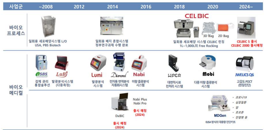
그림 2. 마이크로디지털 제품 로드맵