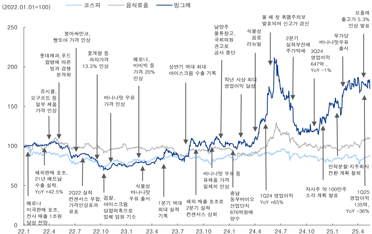
그림 2. 빙그레 주가 추이 및 이벤트 정리