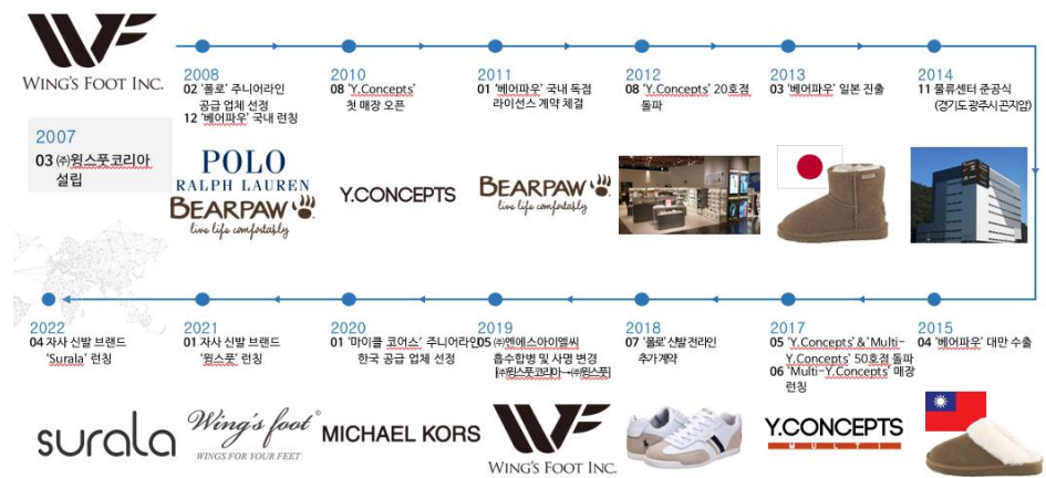
그림 3. 윙스풋 브랜드 히스토리