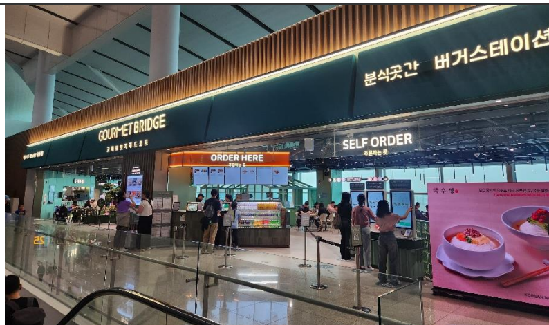
그림 2. 인천공항 2터미널 푸드코트 '고메 브릿지' 순차 확대

주: 위 재무정보는 최근 결산일(2025년 3월 31일) 별도 재무제표 기준