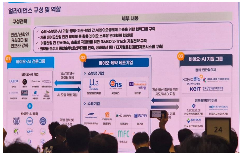
그림 3. 얼라이언스 구성 및 역할