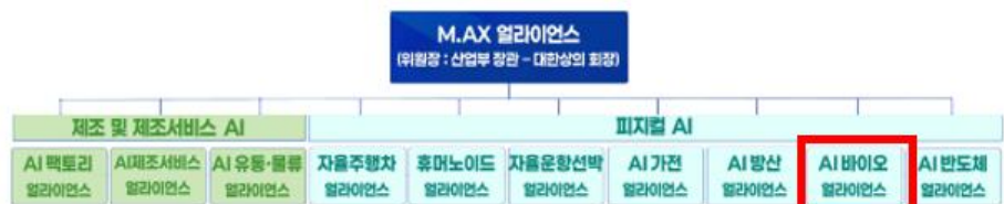
그림 1. MAX 얼라이언스 사업

산업통상자원부는 삼성바이오로직스가 준비하고 있는 바이오 의약품 제조 시설에 AI 솔루션 도입하는 프로젝트에 정부 R&D 자금 지원과 제도적 편의성을 지원 할 것으로 예상된다. 정부의 지원으로 국내 바이오 의약품 산업은 글로벌 경쟁력을 한 단계 레벨업 시킬 기반을 보다 효과적으로 확보할 수 있을 것으로 전망된다.