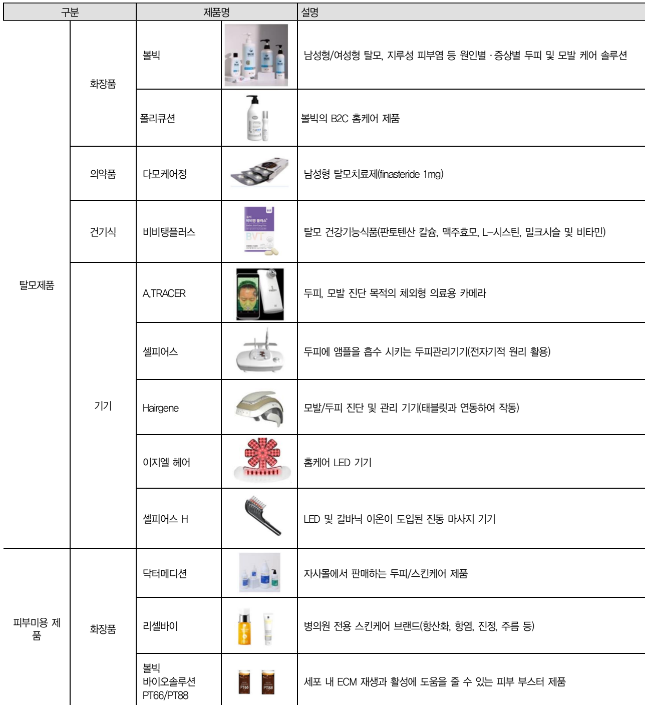
표 1. 이노진 주요 제품