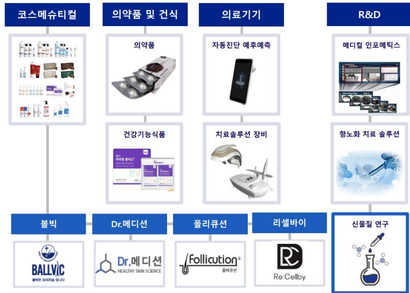
그림 1. 이노진 사업 개요