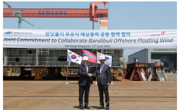
그림 2. 삼성중공업-에퀴노르 반딧불이 부유식 해상풍력 하부구조물 독점 공급 합의