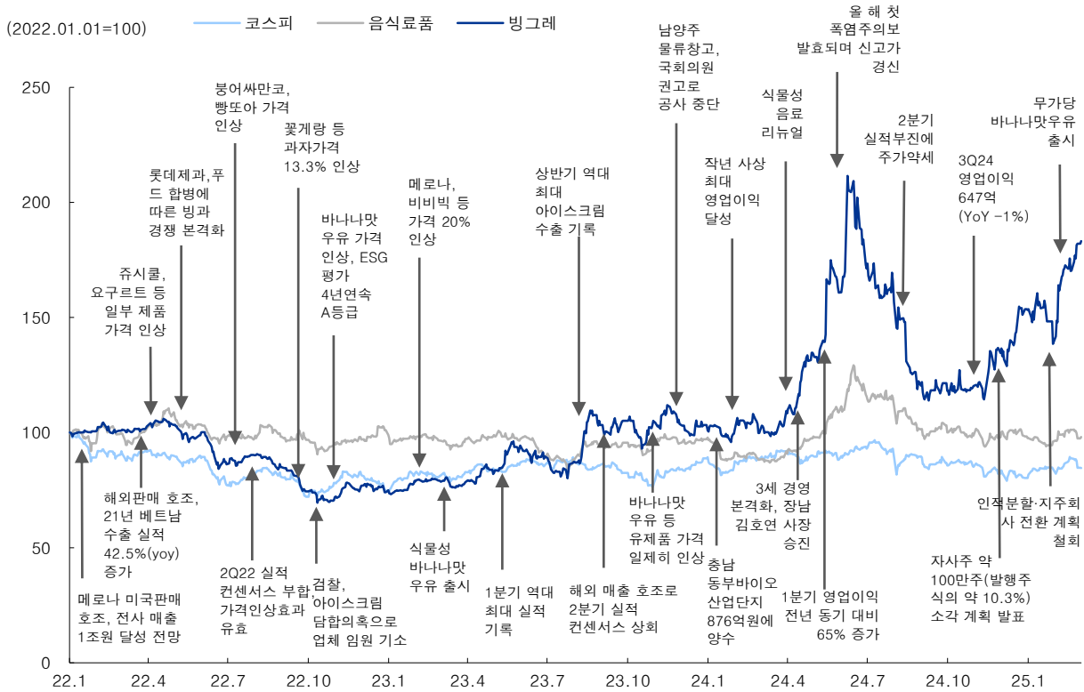
그림 2. 빙그레 주가 추이 및 이벤트 정리