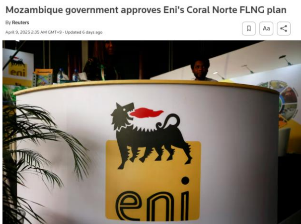
그림 1. 4월 9일 모잠비크 정부의 코랄 노스 가스전 72억달러 투자 승인, 삼성중공업 ENI Coral #2 FLNG 수주 가시화