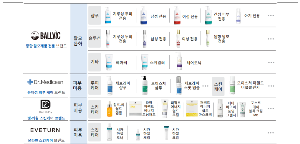
그림 1. 이노진의 제품 라인업