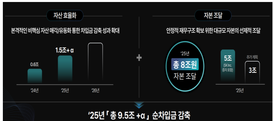
그림 2. SK이노베이션 재무 구조 안정화