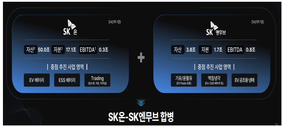
그림 1. SK이노베이션 사업 구조 재편