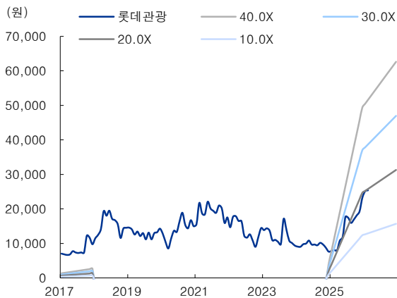
그림 1. 12M Fwd P/E 밴드차트

주: 국내기업은 원화, 해외기업은 달러 기준 / 자료: Bloomberg, IBK투자증권